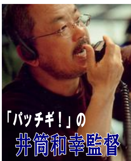
「パッチギ!」の 井筒和幸監督